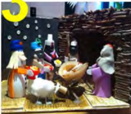
Belén ganador en la Categoría INDIVIDUAL