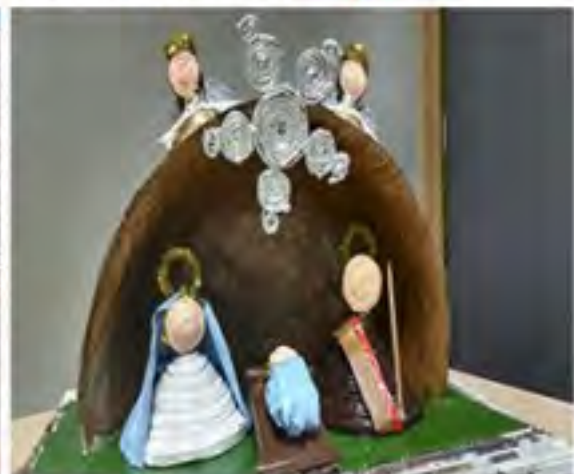
Belén ganador en la Categoría GRUPAL